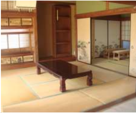
【 建 物 の 内 観 】