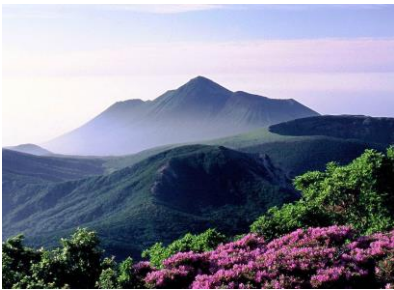
生物多様性保全推進事業 (キリシマツツジの保全)