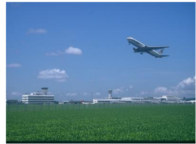
鹿児島空港国際線利用促進事業 (国際線利用促進補助 等)