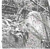
⑬1ヶ所目の工事現場