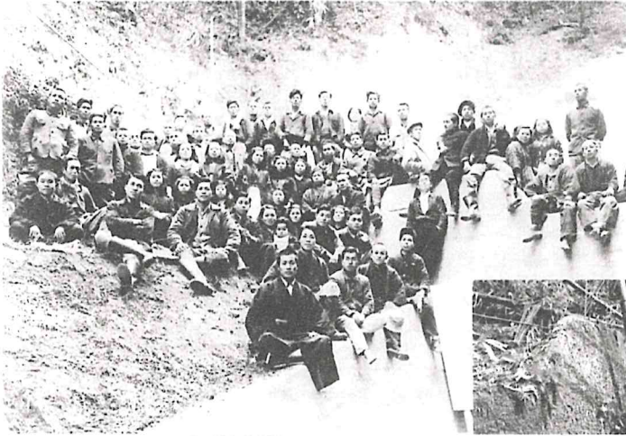
⑬1ヶ所目の集合写真