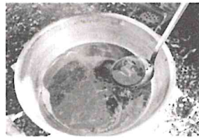
カライモアメを煮詰めたもの