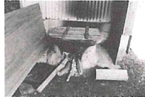
アクマキ、芋アメ、集落にいくつもないお釜