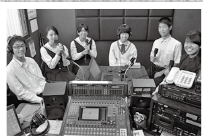
↑市内の高校生がつくる新番組「未来のキミへ～Fromきりしま～」がFMきりしまで開始。放送は毎週金曜(再放送は日曜)午後8時30分～9時です。