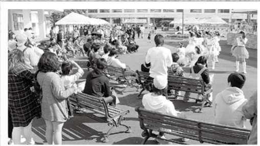
第一工業大学、第一幼児教育短期大学、鹿児島第一医療リハビリ専門学校との合同学園祭「結楓祭」が11月5日、6日、同大キャンパスなどでありました。