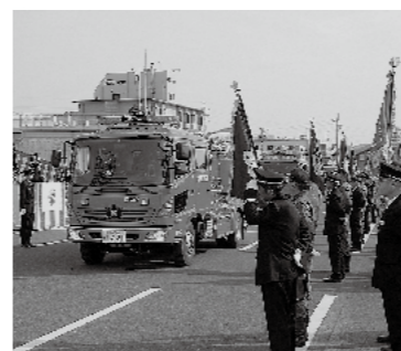
消防車などによる市中パレード

市中パレードや各方面隊による規律訓練、ポンプ操法などを披露します。 ●日時 11月6日(金)午後0時20分から ●場所 市役所周辺、市民会館、お祭り広場 ●パレード 市役所前→パルクプラザ左折→マックスパルク国分店左折→国分駅前左折→お祭り広場 ※パレード中は交通規制あり。 ●式典 市役所前→お祭り広場 天時は、午後1時から市民会館で式典のみ