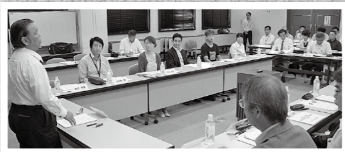
↑ふるさと創生有識者会議が10月24日、国分総合福祉センターであり、平成27年度事業の効果検証や今後の取り組みなどに対する意見交換が行われました。