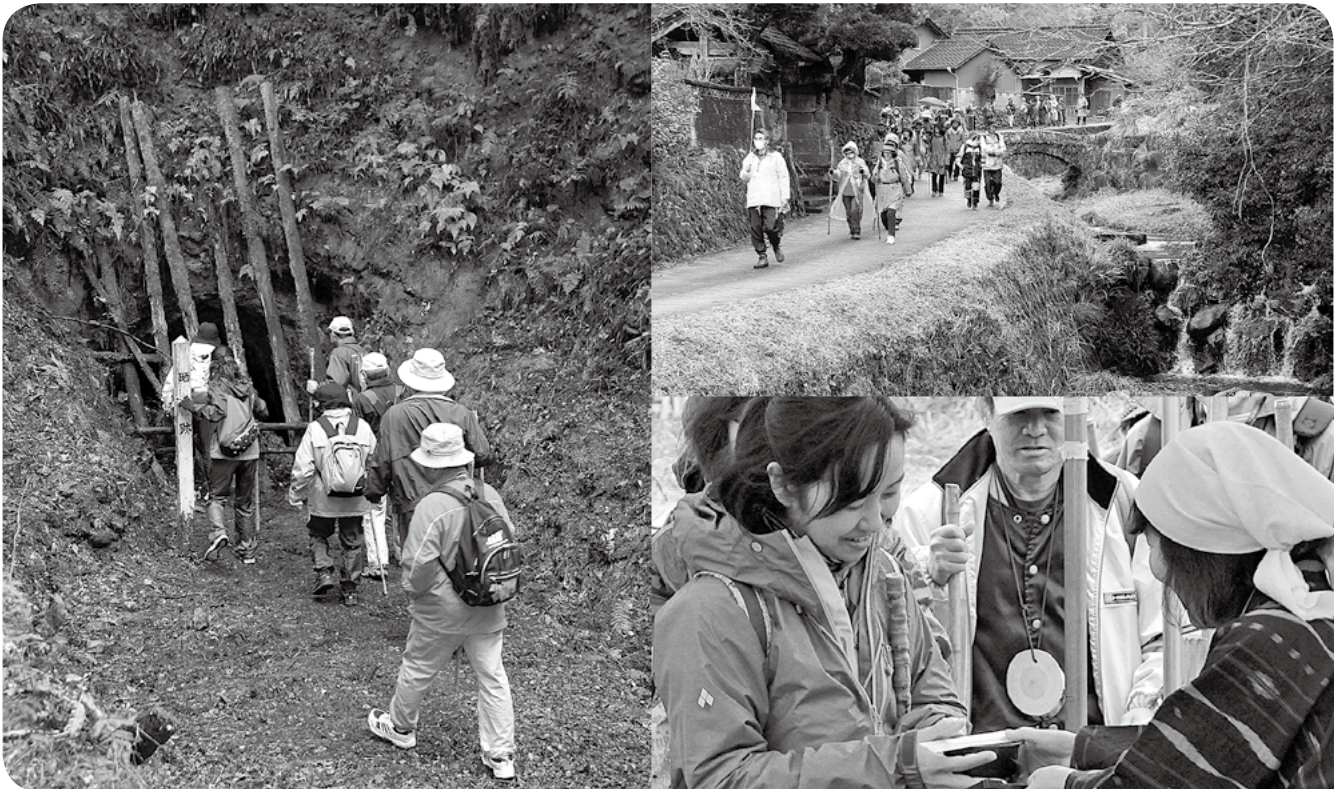
山ヶ野の史跡を巡り、地域のおもてなしを楽しむ参加者