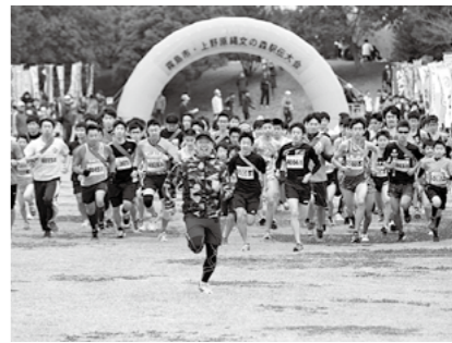
一斉に走り出すランナーたち