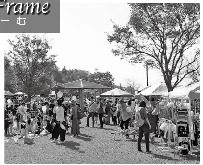
↑初開催の「川端マルシェ」が11月13日、国分野口の河川公園であり、飲食店や雑貨店、花屋など20店舗が出店し、多くの買い物客でにぎわいました。