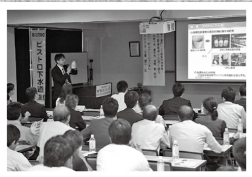
↑下水道の汚泥などの有効活用を図る国の「ピストロ下水道」事業の一環として鹿児島高専が10月21日、同高で専門家による講演会を行いました。