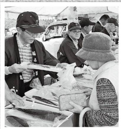
↑天降川や錦江湾で水揚げされた水産物をPR・販売する第1回霧島市水産まつりが11月13日、隼人町の日当山温泉公園でありました。