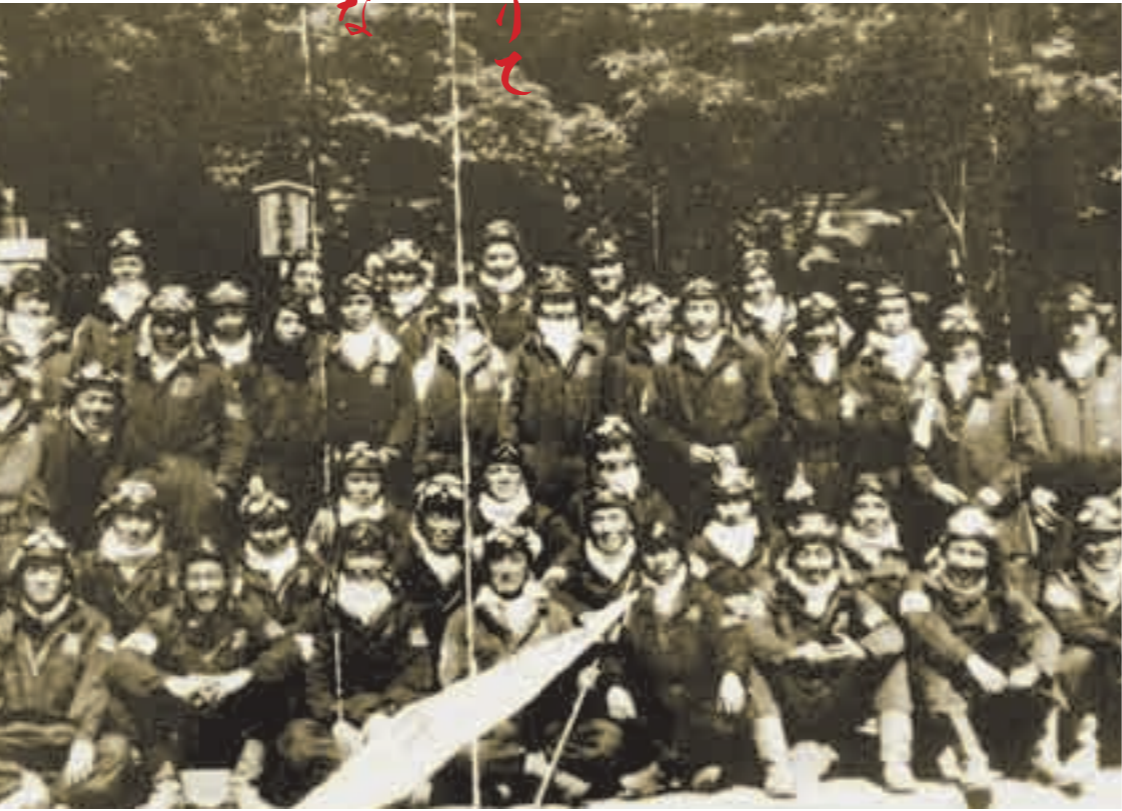
特攻出撃前、鹿児島神宮で祈りをささげ、戦友と記念撮影する特攻隊員

この二つの特攻基地から427人の若者が飛び立ち、戦死されました。二度と戻れないと知りながら敵艦がいる沖繩までの約2時間半の片道飛行、狭い操縦席で隊員は何を思い、突撃していったのでしょうか。溝辺コミュニティセンターにある特攻資料展示室には特攻隊員の遺書などが展示してあります。その中に当時17歳の特攻隊員が残した詩があります。「三千とせ(年)の歴史を守りて 捨つる身を 思えば軽き わが命かな」命をかけて母国の歴史を守らんとする覚悟を決めた詩です。ほかにも家族への感謝の気持ちを込めた遺書がたくさん残っています。きっと特攻隊員が最後に思ったことは「母国への思い、家族への思い」だったのではないでしょ