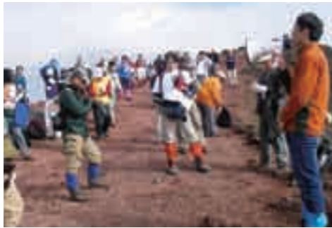
ジオガイド養成講座

霧島ジオパークが日本ジオパークネットワークの「正会員」となるための審査が8月17日から18日にかけてあります。日本ジオパーク委員会から2人の審査員が環霧島地域を訪れ、丸尾滝やえびの高原の池めぐり、関之尾滝など鹿児島・宮崎両県の霧島山周辺で現地審査する予定で、9月ごろには結果が出ます。