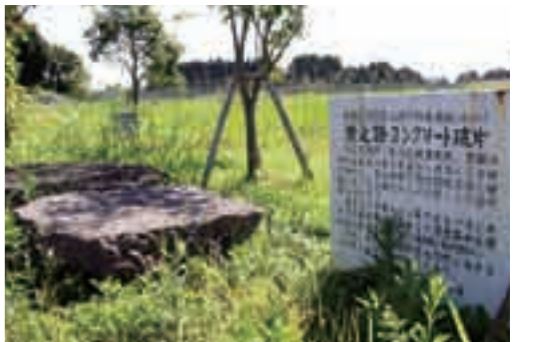
鹿児島空港滑走路近くの空港公園にある、当時の滑走路コンクリート破片

りました。国分基地は昭和17年に完成、当初は航空隊の練習場として使われ、特攻が始まると各地の航空隊が集まり、出撃していきました。第二国分基地は昭和19年末に完成、本土防衛のために急ピツ