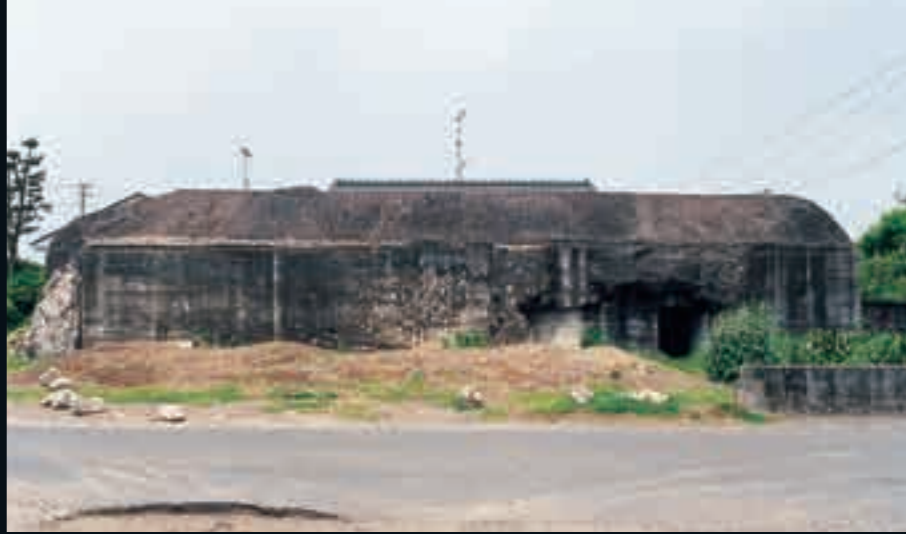
国分地区にある国分基地の発電所跡(約10年前の写真)