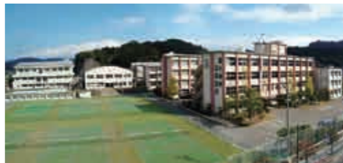
国分中央高校全景

今回新設された「スポーツ健康科」はスポーツだけではなく、健康についての専門性を身に付け、専門知識が必要な学校体育指導者、社会体育指導者と地域や職場でのスポーツリーダーとなる能力や人材を育成します。内容としては地域や大学、病院などと連携した運動プログラムも実施し、小・中・高等学校に出向くなど、より実践に近い授業を進めます。また赤十字救