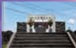
国分の特攻碑公園にある慰霊碑