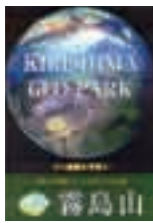
ジオパーク パンフレット

今後のジオパークの推進には、市民みんなが「霧島山」を知り、「ジオパーク」を理解し、人に伝え、ジオパークを活用することが必要です。