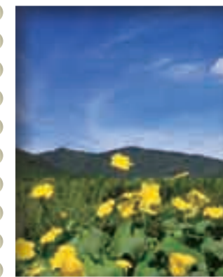
ヘチマ(糸瓜)ウリ科