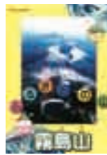
小・中学校の副読本 「ふるさとの山霧島山」