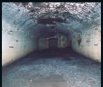
溝辺地区にある第二国分基地指令壕内部(現在は立ち入り禁止)

「戦争を二度としないのは、戦争を経験して、そのことを強く感じています。平和の大切さを一番知っているのは私たち戦争体験者です。生き残った者として、平和の尊さを伝えていくことは私の使命だと思っています」