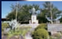
上床公園にある慰霊碑

現在の陸上自衛隊国分駐屯地付近にあり、昭和17年ごろは基礎訓練や急降下爆撃の練習などが行われた。特攻隊が編成されると、各地の航空隊が集結し特攻攻撃に出撃した。