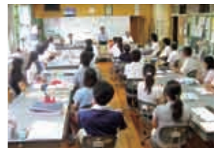
市長・教育長が霧島市立の全小中高校を訪問し、先生方に安全管理の徹底を指導した

4月に起きた陵南小学校での天窓からの落下事故、5月の上小川小学校での落下事故を受けて、市長と教育長が市内の小中学校と高校を巡回し安全指導を行いました。今回の訪問は、教職員の危機管理意識の高揚と各学校の安全対策状況の視察が目的でした。実施日は7月1日から21日までの間の5日間で霧島市立の小中学校35校、中学校14