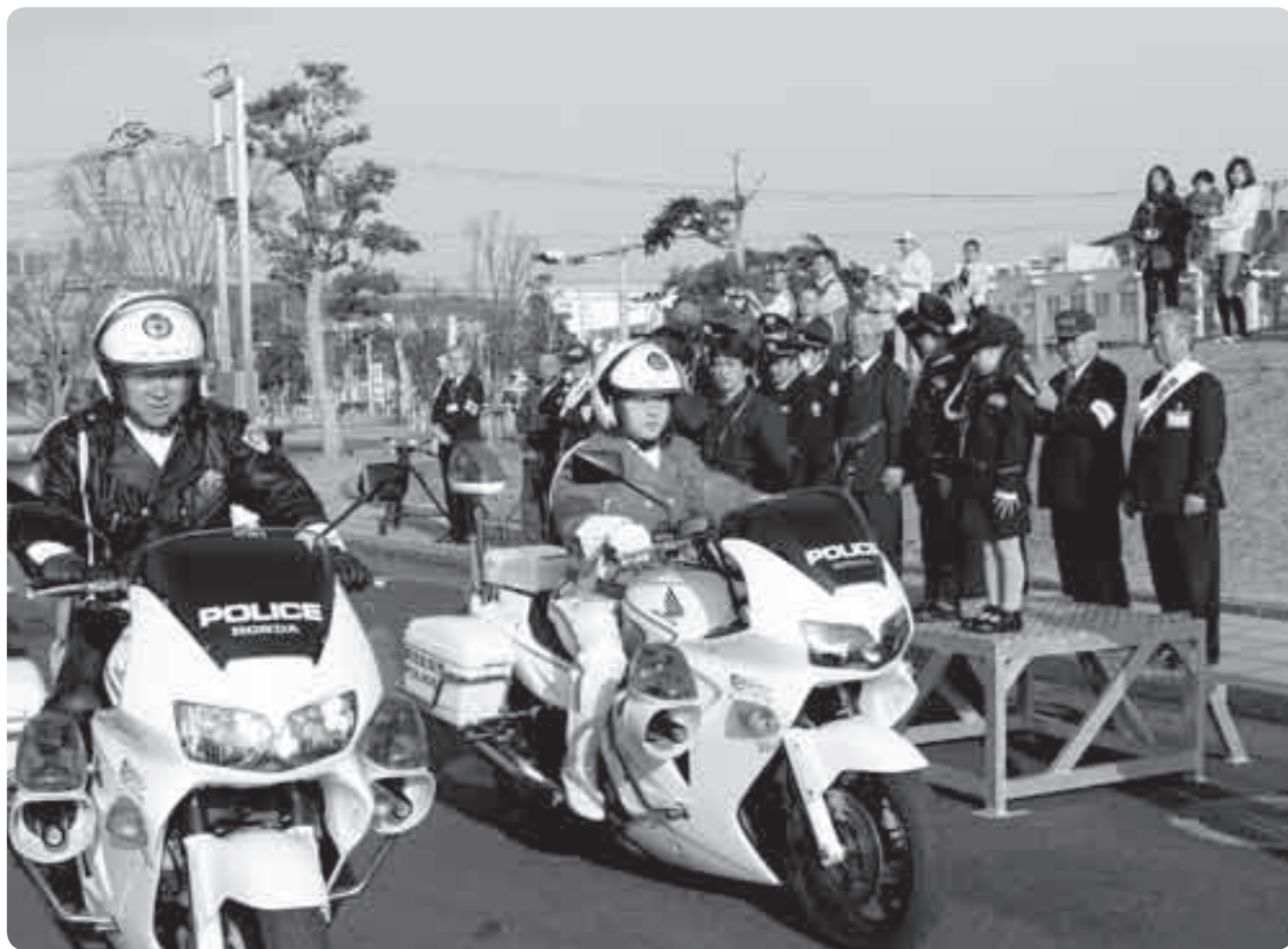
昨年の年末年始特別警戒出発の様子(市役所前)

もうすぐ「師走」。この時期は、空き巣やすり、ひったくりなどの犯罪が多く発生します。またクリスマスや忘年会、新年会などお酒を飲む機会も増えるので、お酒に絡んだ犯罪や事故に気をつけ、安全で安心な年末年始を過ごしましょう。