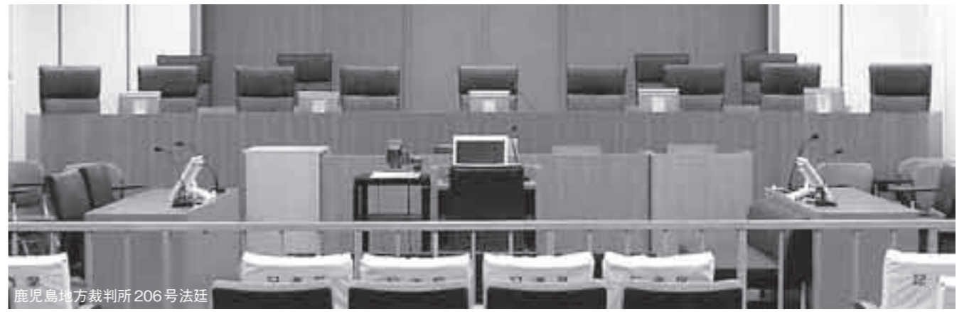
鹿児島地方裁判所 206号法廷