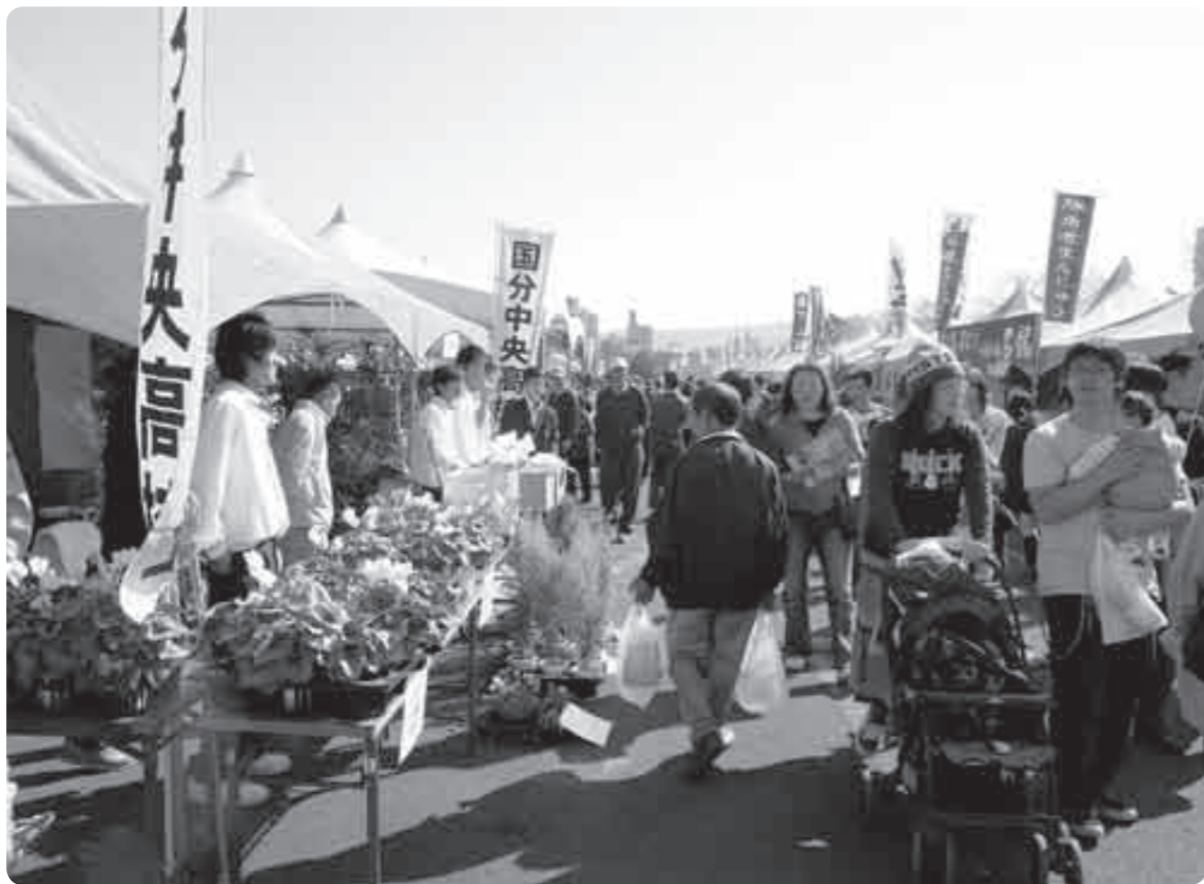
大勢の買い物客でにぎわう霧島ふるさと祭(昨年の様子)

Kirishima City Public Relations, Japan 2008.10 VOL.65