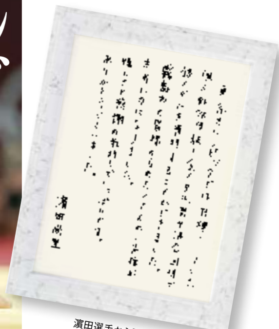
濱田選手から届いた直筆メッセージ