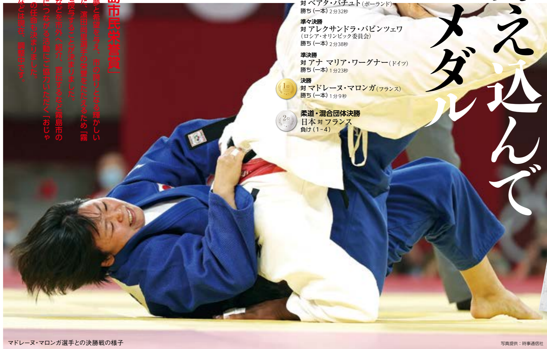
マドレーヌ・マロンガ選手との決勝戦の様子