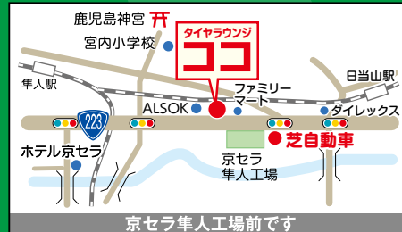
京セラ隼人工場前です

TEL 0995-42-0143 《受付時間》 [月~土曜日] 8:30~17:30