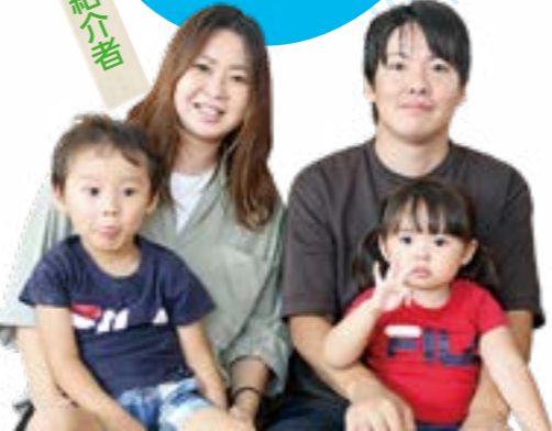
ランチもデザートも大満足。

育児を楽しもう 楽しい育児をサポートするコーナーです。子どもと一緒に出かけたい場所や育児に役立つ情報などを紹介します。