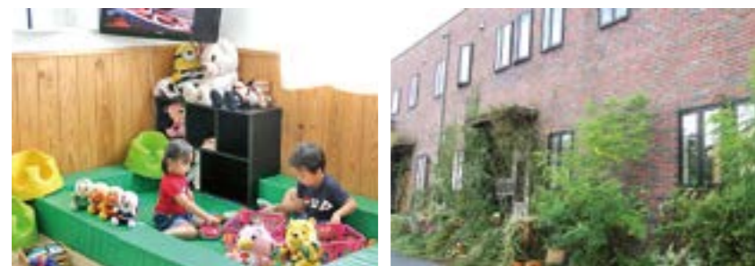
おもちゃがいっぱいのキッズスペース