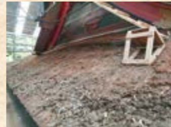
老朽化した檜皮葺の屋根

れます。伊勢神宮は今でもその伝統を受け継ぎ、屋根は茅葺です。ほかには小さな木の板を使用する柿葺、新しいものでは銅板葺などがあります。地域の神社では瓦葺が使われる場合がありますが、基本的には瓦は寺院建築に使われるもので、神社建築に使われるようになったのは、明治時代以降といわれます。