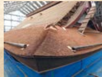
ふき替え途中の屋根