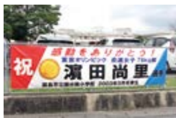
金メダル獲得を祝う横断幕 (国分西小学校PTA作成)

霧島の好きな場所 城山公園。トレーニングを兼ねてランニングしたり、初日の出を見に行ったりした思い出の場所です。 友人の実家である地鶏屋さん。帰省するたびに、食べるのが楽しみ。