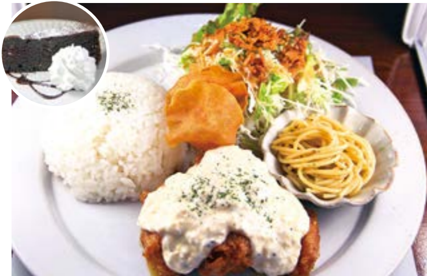
人気のチキン南蛮ランチ(ケーキ付き) 1,200円(税込み)

店長から一言／1階が美容室、2階がカフェ・雑貨店となっており、カフェではランチメニューや日替わりケーキなどを取りそろえています。女性のお客さんだけでなく、男性のご来店も大歓迎。雑貨店は、30人の作家さんの作品で品ぞろえも充実。雑貨を見るだけでも気軽にお越しください。