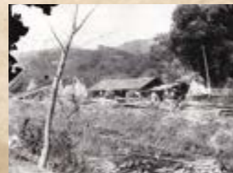
檜皮葺の職人たち。用水路には檜皮の束（昭和3年）

規模のものであったという記録があります。義久が造った建物の屋根は小板葺（柿葺）と記されており、檜皮葺ではなかったと考えられますが、いつから檜皮葺になったのかは分かっていません。宝暦の造営当初の図面は残っており、檜皮葺であったかどうか定かではありません。前述のとおり、本殿はかなりの大きさであり、使用する檜皮の量も多くあります。檜皮は主に寒い地方で採れるため、材料を確保するのは非常に難しかったのではないかと想像されます。昭和3（1928）年に本殿改修を行った際の屋根は、檜皮葺でした。単に歴史民俗資料館に、その時に撮影された写真が残っています。