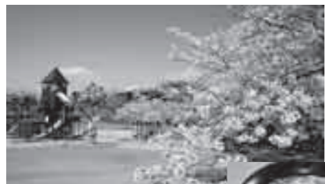
桜満開の丸岡公園