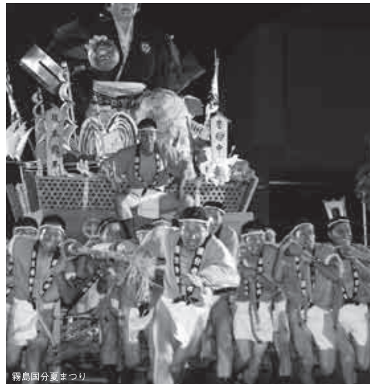
霧島国分夏まつり