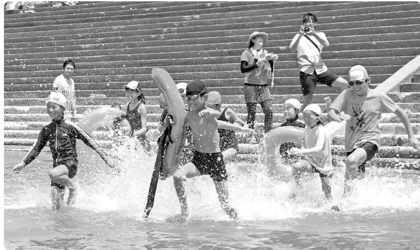
小浜海水浴場海開きで海に駆け込む子どもたち