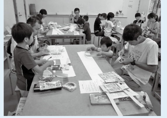
親子でからくり絵本づくりに夢中