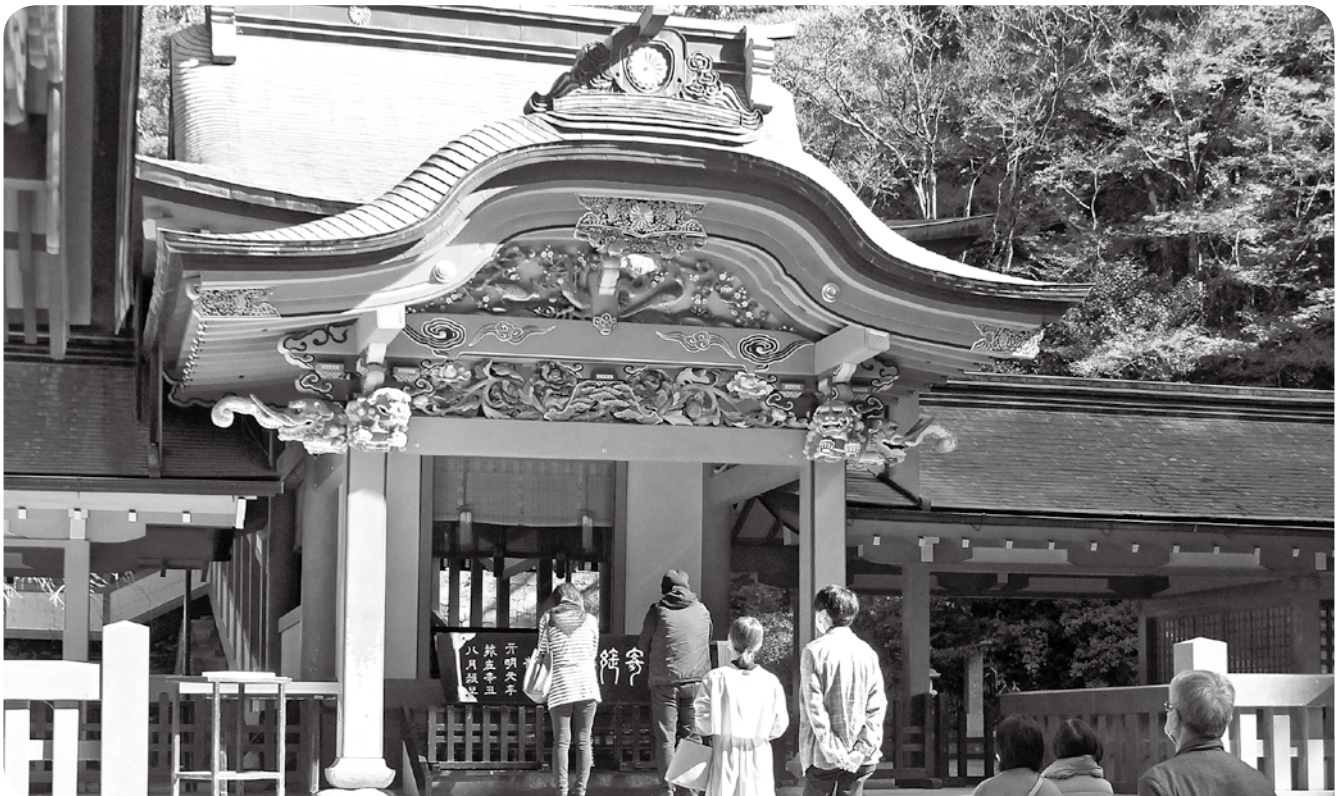
前の人と距離をとって並ぶ参拝客(霧島神宮)