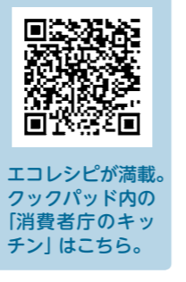
エコレシピが満載。フックパッド内の「消費者庁のキッチン」はこちら。

生が農業、工業、商業、福祉、看護の専門的な学習の魅力を紹介します。パネル・作品展示や体験活動などがあります。 日時 11月8日(金) 午前10時～午後3時 場所 II 国分シビックセンター1多目的ホール 対象 II 市民 入場料 II 無料 参加校 II 国分中央高校、霧島高校、隼人工業高校、福山高校、伊佐農林高校、蒲生高校、加治木工業高校、龍核高校 ◎問 II 国分中央高校 ☎(46)1535