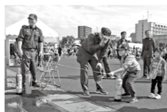
水消火器体験の様子

試食、市幼少年消防クラブ員の演技や車両展示があります。災害時に役立つ動作で競技をする防災運動会や、きりしまサンシャインガールズのライブなどもあります。