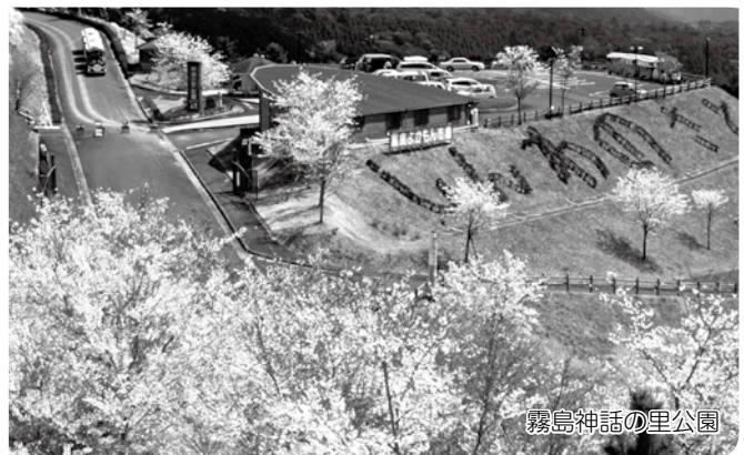
霧島神話の里公園