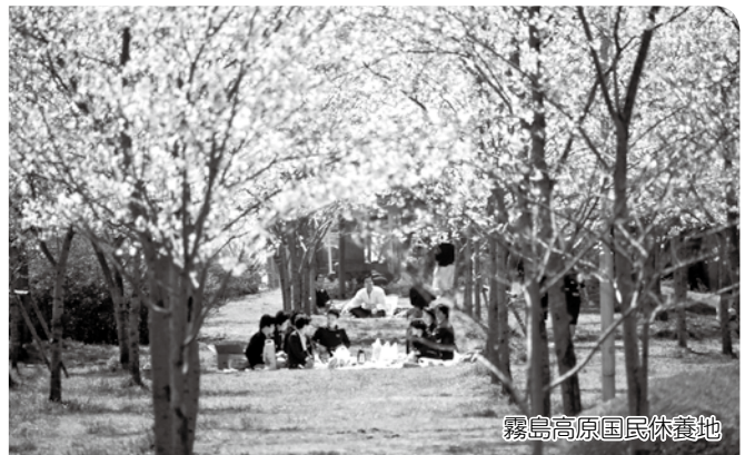
霧島高原国民休養地