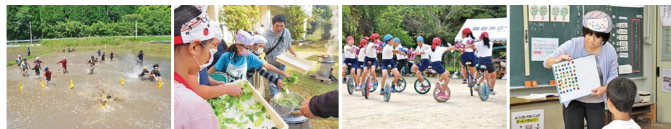
泥んこ遊びでの田んぼフラッグ

娘と一緒にいった体験入学で、在校生による楽しいレクリエーションや一人一人に合わせた授業を体験し、すぐに娘は通いたいと言いました。今では第2人も通っています。自然豊かな場所で田植えなどを通して地域の人と密接に関わったり、少人数の授業で自分の意見が言えるようになったりと、子どもは生き生きとした表情で毎日通っています。登下校時間に路線バスが走っているので、とても助かっています。