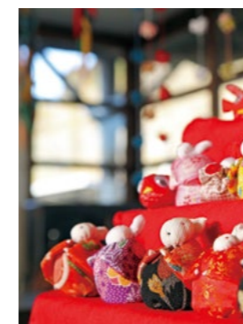
あかね ひな 茜さす雛照らされど (横川町中ノ) 平成29年2月15日 午後4時13分

◎人口/125,824人(-22) ◎世帯数/60,617世帯(+2) ・男性/60,711人(±0) ・女性/65,113人(-22) ・出生86人・死亡104人・転入292人・転出275人 (平成31年1月1日現在)