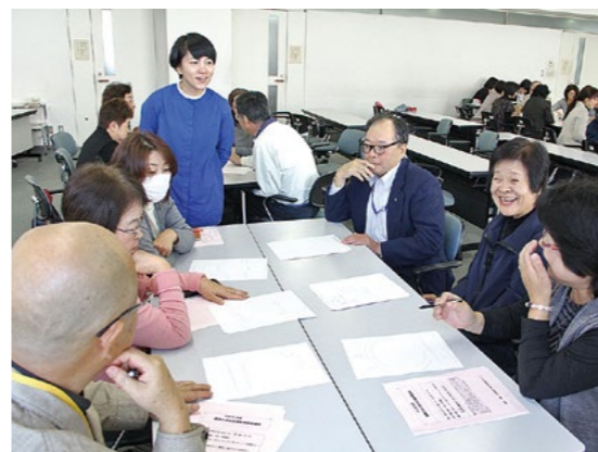
互いの違いに理解を深める男女共同参画講座

「紙に丸を描いて、その上にもう一つ丸を描いてください」。その後も、隣を見ないで図形を描くよう指示が続きます。描き終えた30人が互いに見せ合うと、同じ絵は一つもありません。「上」という言葉を平面的に受け取り丸の外に書く人、立体的に受け取り丸の中に書く人などそれぞれでした。「私たちは一人一人、考え方や言葉の受け取り方が違います。それだけ言葉は伝えることが難しい。だから互いの間に違いがあることを自覚した上で関わり合っていくことが大切です」