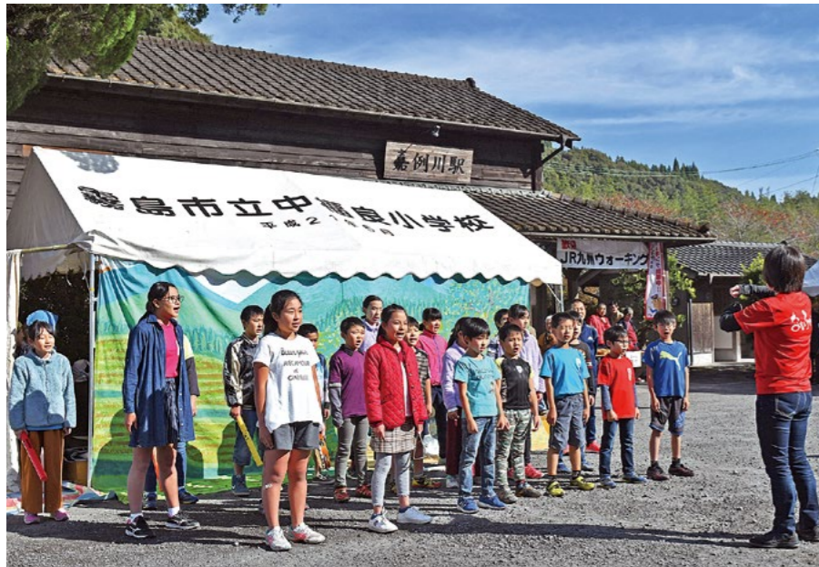
嘉例川駅で行われる祭りで合唱