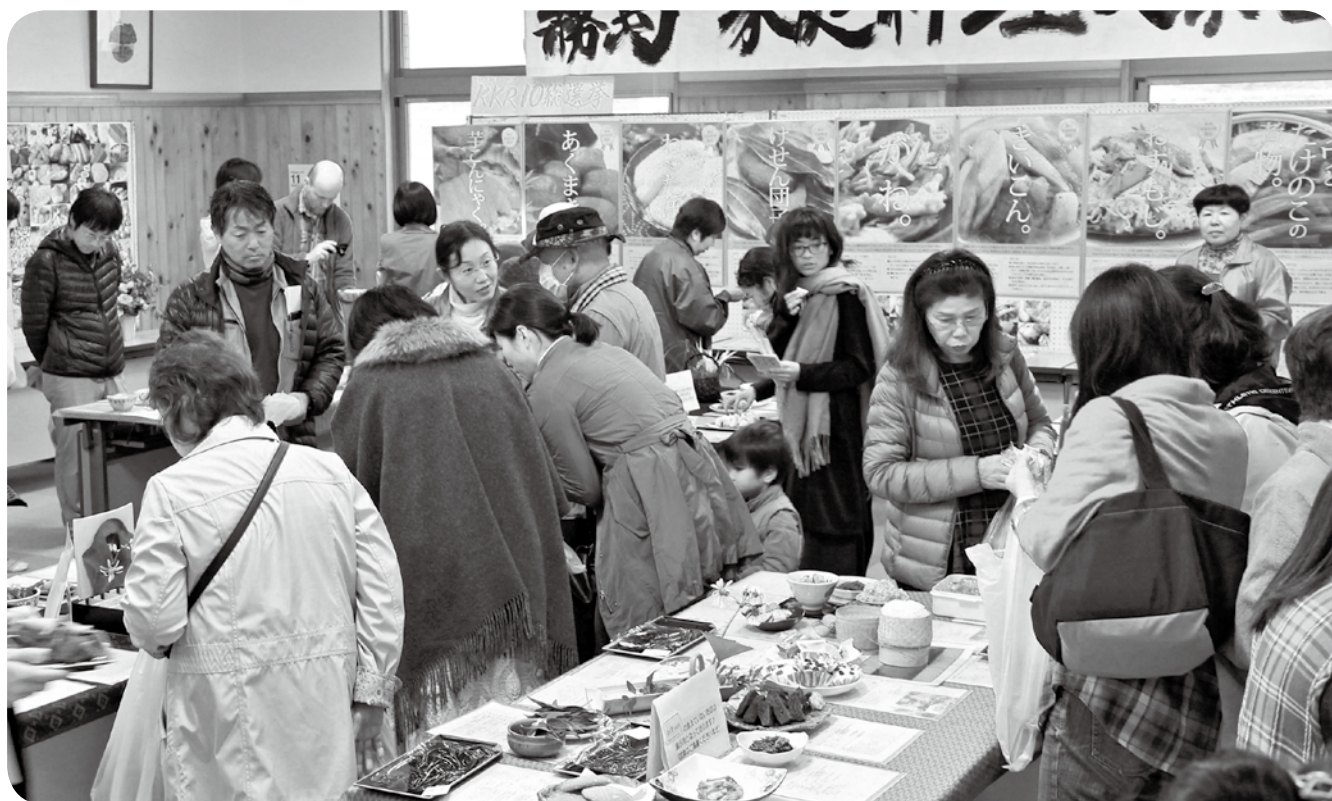
展示された家庭料理とレシピに見入る来場者