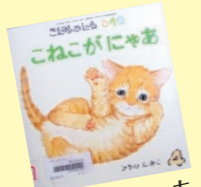
こねこがにゃあ 作者：ひろの たかこ

1歳になった娘のお気に入りの絵本です。いろいろな所に子猫が隠れていて、子猫が出てくたびに娘は、大喜びです。子猫の愛らしさを感じる本なので、猫好きな方にはお勧めの一冊です。これから、もっともっと娘に、いろいろな絵本の世界を見せてあげたいです。