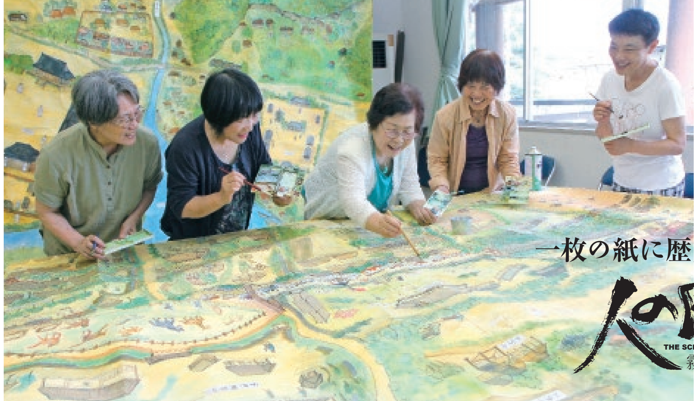
古絵図を描く会の作品