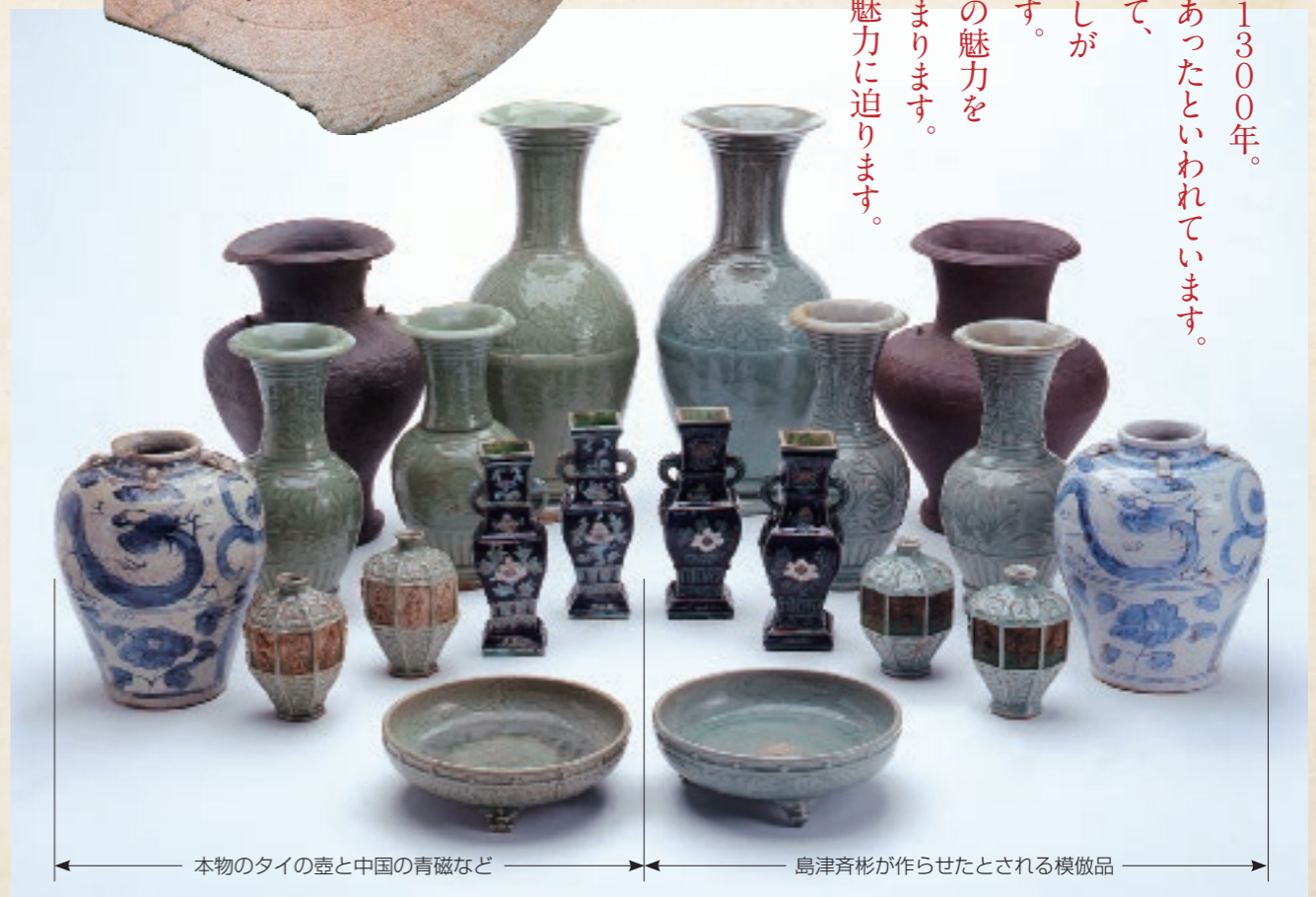
← 本物のタイの壺と中国の青磁など → ← 島津斉彬が作らせたと思われる模倣品 →