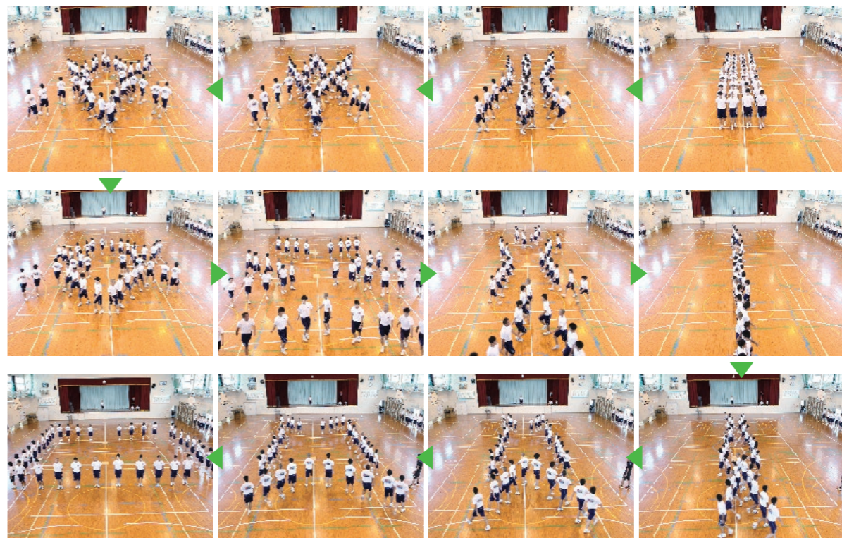
万華鏡のように形を変える集団演技