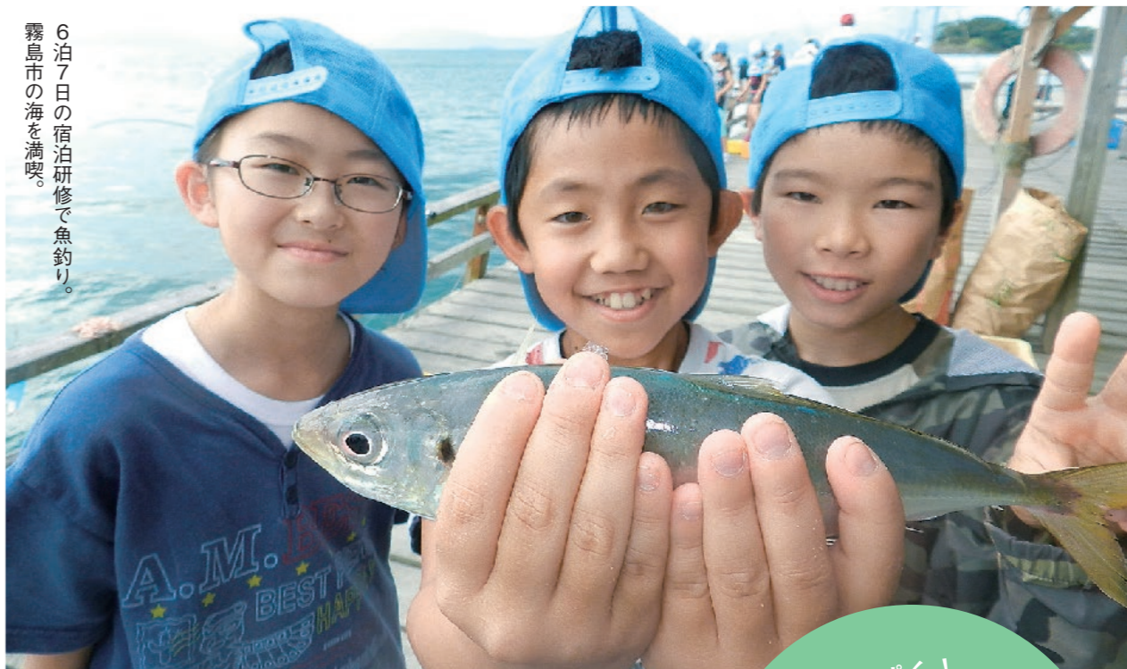
6泊7日の宿泊研修で魚釣り。 霧島市の海を満喫。

わんぱく！ きりしまっ子自然体験事業 【異年齢集団の研修でたくましく】 霧島市の海・山・川などの豊富な自然環境を生かした自然体験活動を実施します。学年の違う異年齢集団による6泊7日の宿泊研修「いざ行け！きりしま探検隊」を実施し、心身ともにたくましい「きりしまっ子」を育成します。 ☎=生涯学習課 ☎(42)1118