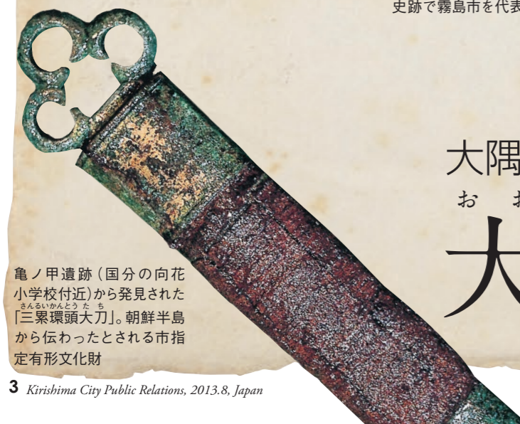
亀ノ甲遺跡(国分の向花小学校付近)から発見された「三累環頭大刀」。朝鮮半島から伝わるとされる市指定有形文化財

隼人歴史民俗資料館 企画展 ●入館料=小・中・高校生60円、一般120円 ●開館時間=午前9時から午後5時 ●休館日=月曜日(祝日は翌日) 県歴史資料センター黎明館 ●入館料=小・中学生120円、高校・大学生190円、一般300円 ●開館時間=午前9時から午後6時 ●休館日=月曜日(祝日は翌日)、毎月25日(土・日は開館)、12月31日～1月2日