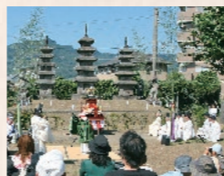
隼人塚で慰霊の神事

会を行え」との 3 信託を受けて、魚や鳥獣を野に放し殺生を戒める宗教行事「放生会」が始まりました。これは、私たちの町でも、鹿兒島神宮に「浜下り」という行事で伝わっています。浜下りは、鹿兒島神宮を出発して、「隼人塚」に立ち寄り慰霊の神事を行い、八幡屋敷を経て、浜之市で鯛を放し、その後、再び鹿兒島神宮まで上る一連の行事です。隼人塚では、隼人によって代々踊り継がれてきた隼人舞も奉納されます。