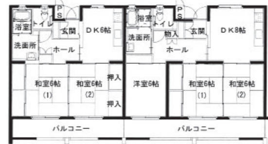
2DK 床面積 55.5㎡