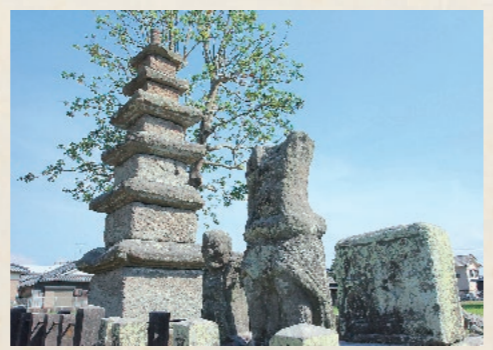
国分中央にある大隅国分寺跡。国指定史跡で霧島市を代表する史跡の一つ

大隅国の一の宮として栄えてきた大隅正八幡宮(現、鹿児島神宮)とそれを支えてきた杜家の館跡。そこから出土した大量の海外の陶器や国内各地の陶器などを展示・解説し、これらの焼き物が海を越えてやってきた意義について考えます。さらには、鹿児島神宮宝物のタイの壺、中国青磁なども展示されます。