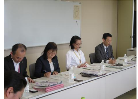
東村山市保険年金課の説明

国の負担率が下がる中、国保税の値上げと医療費の値上げ。保険者としてこの切ない状況を打破するために、データヘルス計画策定に先駆け国保医療費分析を行うようになった。東村山市では医療費総額最大の上位疾病は「循環器系の疾患」であり、高額レセプトは医療費全体の3割を占める。患者1人当たり医療費の最大は「腎不全」で、人工透析患者の約6割は糖尿病性腎症が原因である。多受診患者の実態となる疾病や頻回受診、重複服薬の要因など分析し可視化することにより、患者本人にアプローチするプログラムが展開され、予防事業、若年層の健康診査など医療分析に基づく保険事業を展開している。