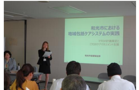
和光市長寿あんしん課の説明

「地域包括ケアシステム」を模範として構成した「妊娠期からの切れ目のない支援～わこう版ネウボラ」その介護保険部分について。フィンランド語で「アドバイスの場」を意味する支援制度の名前のネウボラ課。政策的な「マクロ」と個別的対応の「ミクロ」を連携させながら、在宅限界点を高めるためのサービス基盤整備と食の自立栄養改善サービス等の和光市独自の特別給付や、日々の地域ケア会議の効率化などの工夫は民官あげての人材育成に繋がり、要支援者の介護認定の年間寛解40%という数字や、保険料の抑制に効果を出している。