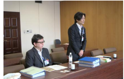
品川区子ども育成課の説明

区内37校、全ての学校内に設置された「すまいるスクール」は、「放課後児童クラブ」と「放課後子ども教室」を一体的にした全児童放課後等対策事業で、区直営で運営されている。放課後の安全が問われる中、1年生の登録率97.8%という数字からも保護者の支持とこの事業の必要性が伺える。特徴としては学校施設を活用し、自由に遊べ、学年を越えた交流ができる「フリータイム」、日本の伝統文化からスポーツ、環境などを体験する「教室」、そして週1回程、教員免許を持つスタッフが担当する「勉強会」の三つの柱で運営されており、その中心には区民協働という考え方がある。区内の大学やNPOはもとより、地域ボランティアは個人・団体・企業を合わせ約760名。見守りとしての「まもるっち協力者」個人約11,000名など、共同研究や、活用、協力と言った様々な形での応援をもらい児童指導ができています。