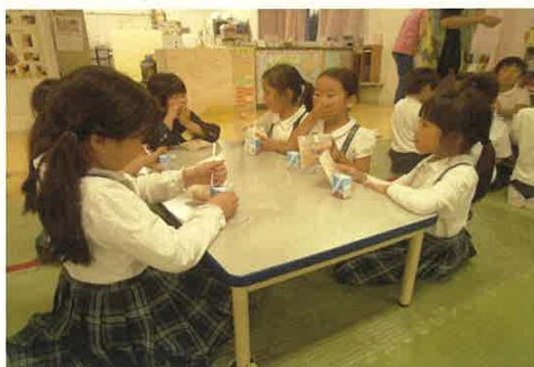
間食 (おやつ) の提供

今回の視察を終え、それぞれの自治体の先進的な取組を勉強できた。和光市では、高齢者福祉だけではなく子育て支援も含めた包括的な視点でのマネジメントを計画しており、東村山市では、糖尿病の重症化予防等を通しての医療費削減等に取り組んでいた。品川区においては、区長部局と教育委員会が一体となって素晴らしい成果を挙げていた。ただ、霧島市とは市の面積や人口、産業形態など、大きく異なる点も多いので、これらを参考にしながら、市政に取り入れていきたいと思った。