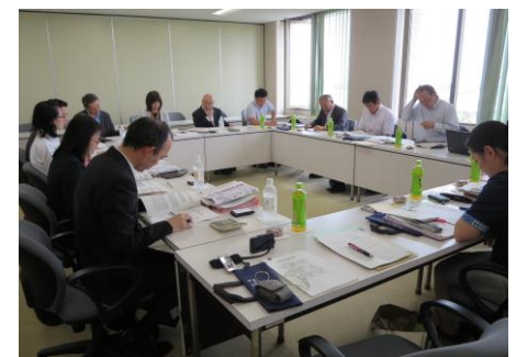
熱のこもったご説明をいただきました

A：広島県「呉市モデル」といわれる糖尿病性腎症の透析予防事業者として成果を上げ、医療費分析に特化した特許技術を持ち、糖尿病患者を傷病ステージごとに抽出、階層化でき、人工透析療養に入る前段階の患者抽出ができる唯一の事業者ということで、（株）データホライゾンへ医療費分析やデータヘルス事業を委託することにした。