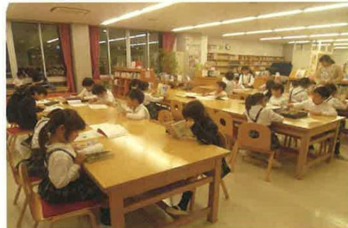
間食後の宿題タイムの様子