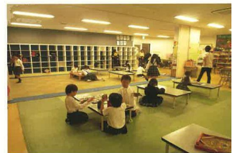
すまいるスクール品川学園の様子

A：すまいるスクールは実施当初、教育委員会の事業であったこと。すでに区内全校実施から10年以上経過したことで、学校管理職の理解がある。地域の団体が使用する校庭や体育館も、多くの学校で17時を目安に区切って利用するので棲み分けができています。