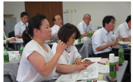
全国的な先進地で視察の申し込みが多いため、4市での合同研修会でした

A：要介護（要支援）認定率が全国平均、埼玉県平均と比較しても低く安定している。推移を見ると、全国平均は平成18年に16.7%が平成29年では18.3%。一方和光市は平成18年が12.0%だったのが年々落ち、平成29年には9.7%と、10%を下回る水準を維持し続けている。