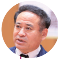
竹下 智行 議員