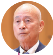
池田 綱雄 議員