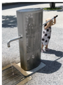
熊本駅前の防災井戸

答 本市の水道水源は湧水28か所、地下水27か所の全55か所あり、給水活動に必要な水道水は、被害の無かった水源の配水エリアを拠点とすることで対応できる。今後も(仮称)宇都良配水池の新設事業をはじめ、水道施設の耐震化を推進し、安全で良質な水の共有に努めていく。