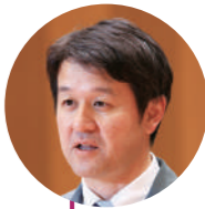
今吉 直樹 議員

問 令和6年8月8日に発生した日向灘の地震の影響で水道水が濁り利用できない状況が発生し、市民生活や経済活動に大きな影響が及んだ。今回の教訓や昨今の被災地の状況から、上水道以外で飲料水を確保し、有事の際の市民生活や経済活動の維持に備える必要があると考えるがどうか。