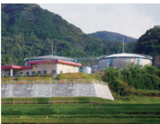
国分台明寺配水池

答 現在台明寺配水池に代わり整備中の(仮称)宇都良配水池の貯水量は、現在の約2倍となるため、柔軟に対応できると考えている。