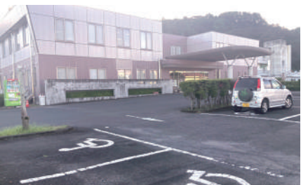
霧島市医師会医療センター駐車場