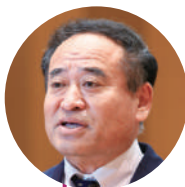
竹下 智行 議員

問 児童生徒が、悩み・苦しみを乗り越えるため、福祉専門職を活用した授業の導入はできないか。