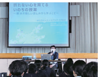
いのちの授業の様子

答 本市では、それぞれの学校において、外部の専門職による「いのちの授業」や、いじめの防止に関する講話や認知症の理解促進をはじめとする福祉に関する講話、体験活動などを実施している。今後、さまざまな地域の専門人材と積極的に連携し、児童生徒の心の教育に努めていく。