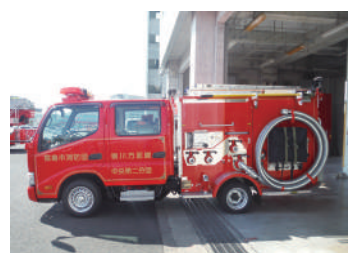
法改正対応の消防ポンプ自動車

答 道路交通法改正に伴い、消防ポンプ自動車を運転するためには準中型免許が必要となったが、現状の運行には支障はない。令和5年度の車両更新では普通免許で運転可能なオートマ車両を導入しており、今後の更新も同車両の導入を検討している。補助については、他自治体の状況を注視し調査をしていきたい。