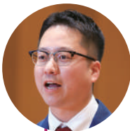
植山 太介 議員