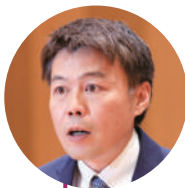
徳田 修和 議員