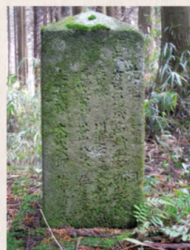
①春山に残る薩摩軍の墓石