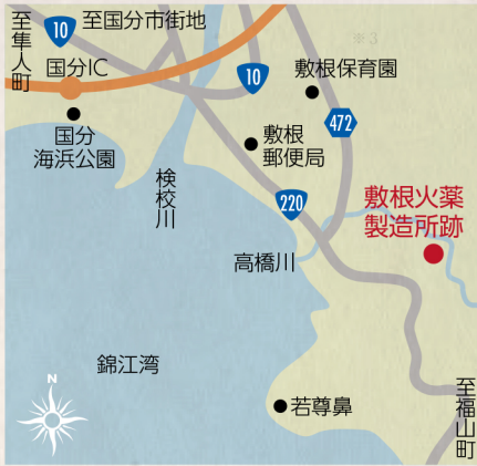
※跡地は私有地のため立ち入りはできません。

文久二（一八六二）年八月、島津久光一行が起こした ※1 生麦事件が発端となつて、翌年七月に薩英戦争が起きました。この戦争で鹿児島城下の大半が消失し、島津斉彬が建設を進めた鹿児島市磯地区の工場群も壊滅的打撃を受