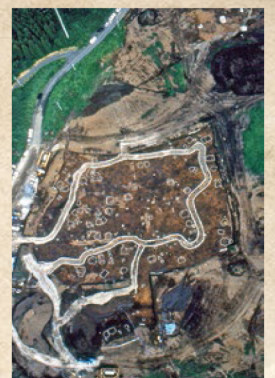
約9500年前の定住集落跡