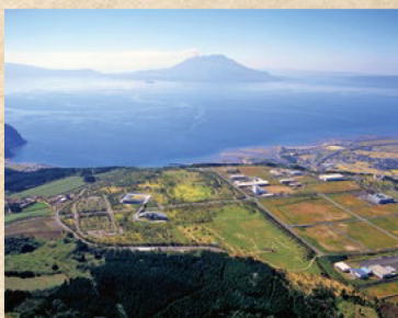
上野原遺跡の全景